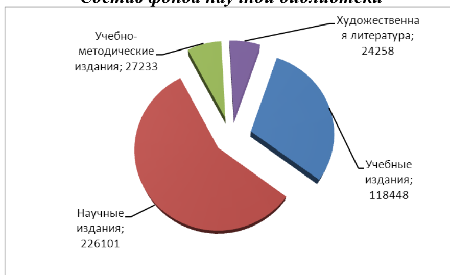
Состав фонда научной библиотеки

В целях обеспечения пользователям неограниченного доступа к широкому спектру учебной, учебно-методической и научной литературы пользователям библиотеки предоставлен доступ к внешним полнотекстовым ресурсам в двух режимах: подписка и тестовый доступ.