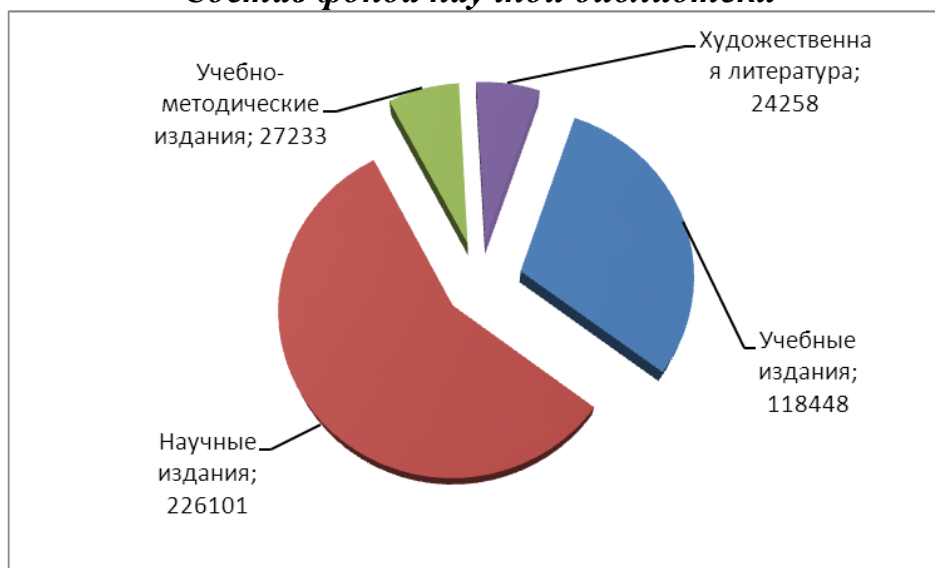
Состав фонда научной библиотеки

В целях обеспечения пользователям неограниченного доступа к широкому спектру учебной, учебно-методической и научной литературы пользователям библиотеки предоставлен доступ к внешним полнотекстовым ресурсам в двух режимах: подписка и тестовый доступ.